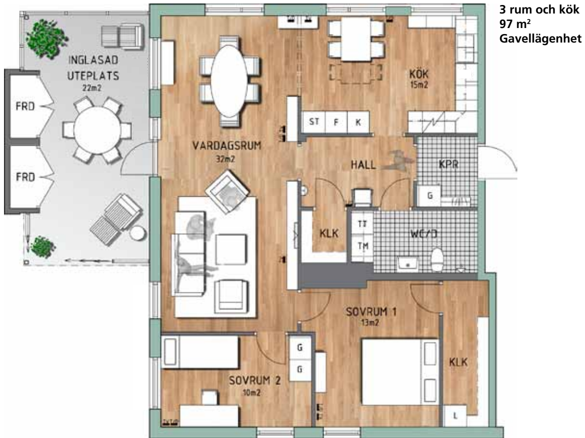
3 rum och kök 97 m 2